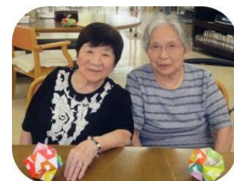
折り紙 月替わりにて 様々な折り紙 に挑戦しまし た。