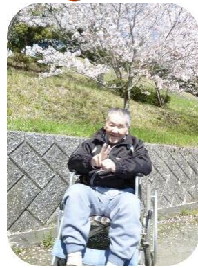
お花見 桜の木の下で ハイポーズ!