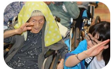
姉さんかぶりで ヨイショ！