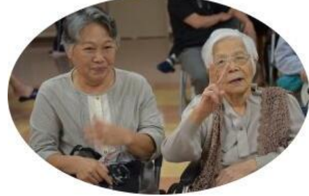
笑顔でなかよく ピース！