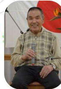
敬老会 お祝い、 うれしいな！