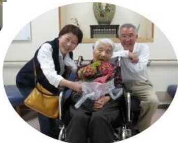
母の日のお祝いにお 花を持ってきてくれ ました。