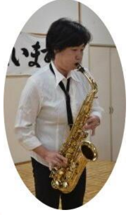
わたあめは、とても甘くておいしいな 職員が サクソ演奏 を披露しまし た。