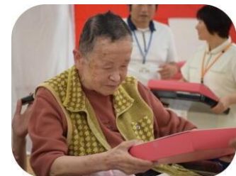
敬老のお 祝い、 うれしい ですね。