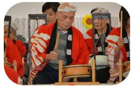
民謡太鼓 たくさん練習し ました、 さあ成果の披露 ですよ。