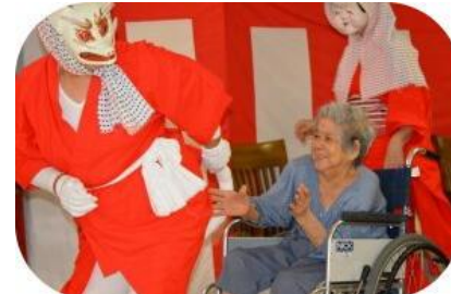
キツネがコン！ ほれほれ、よい と。 とっても楽しい 芸でした。