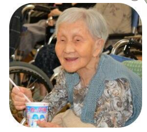
おいしくて笑顔です