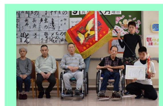
田川筑豊を中心に活動されてい る「和太鼓たぎり」のみなさん が、県大会の優勝報告に見えま した。身体に響く太鼓の音に元 気をたくさんいただきました。