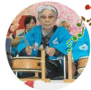
花見の行事 の時に民謡 太鼓を叩き ました。