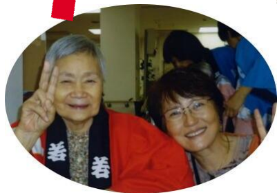
夏まつり 楽しい夏まつり 親子でハイチー