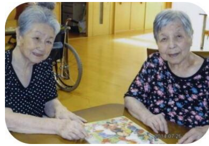
パズル お昼のひととき仲 良く頭の体操、リ フレッシュ!!