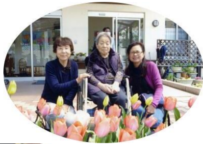
チューリップ畑 みんなで育てたチュー リップとてもきれいに 咲きました。