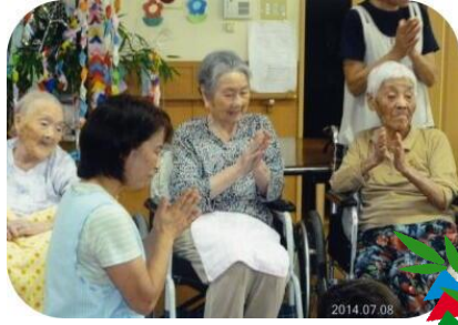
七夕祭 年に一度 七夕様 会えるのを楽しみに しています。どうぞ 願いを叶えて下さい