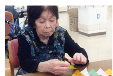
七夕 短冊や飾り付けを作成し、飾りつけました。