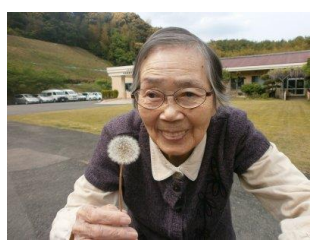
散歩中にタンポポ発見！