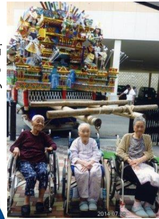
山笠 今も昔も太鼓や笛 の音に身体が踊る 心が弾むうれしい ですね。