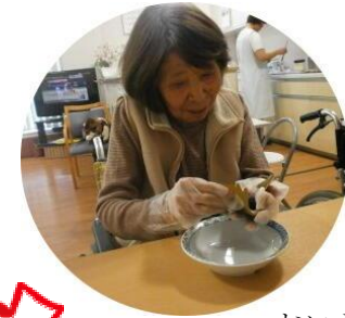
おいしく出来ました。