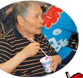
冷たくて おいしかったなあ