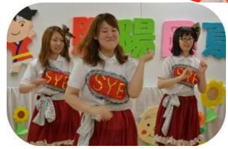
恋するフォーチュンクッキー、 夜遅くまで頑張りました。