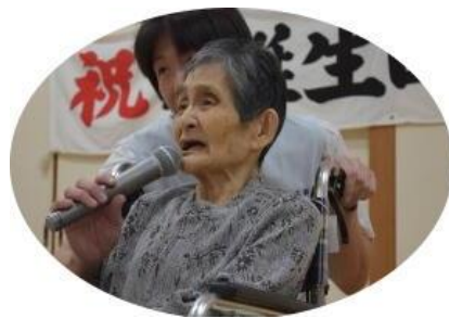
誕生日会 カラオケで歌声を披 露しました、 上手でした！