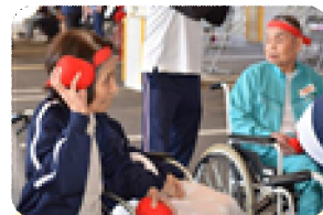
紅組の勝利のため、真剣に頑張るぞォ～!!