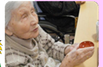
とことん、飲みます(～)v