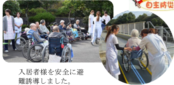
入居者様を安全に避難誘導しました。