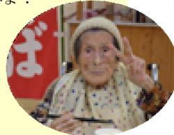
忘年会でいっぱい食べて、100歳の良い一年でした♪ (๐๐)(๐๐)