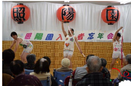
新体操 男性職員による新体操