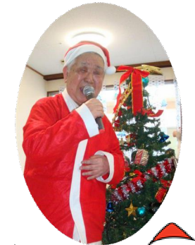
からの・・・カラオケ大会へ