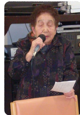
得意の詩吟を披露していただきました。