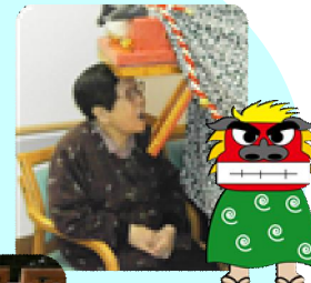
鬼を外に追い出して、今年も福が来ますよォ～に★ ( ) / . . .