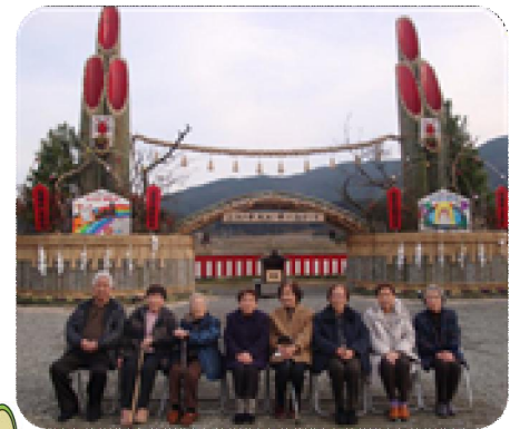
大門松 今年も一年 元気に よろしくお願いたします。