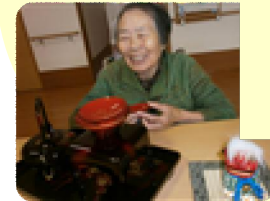
★今年も良い一年でありますように☆