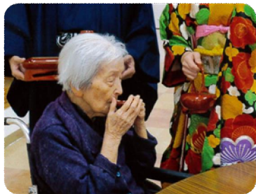
新年のはじまりです。