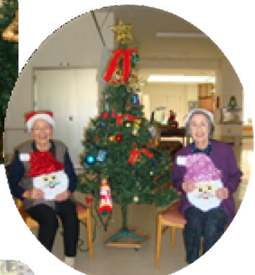
仲良くドレスアップ