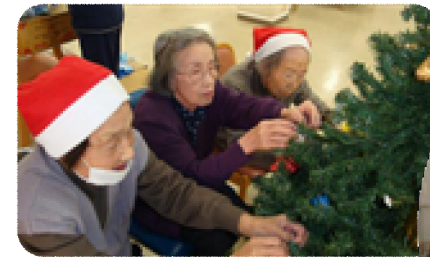
クリスマス飾り付けからの記念撮影