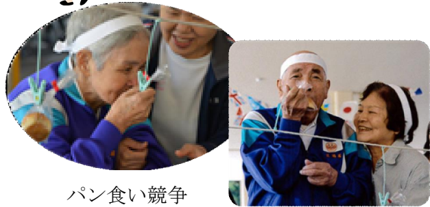
パン食い競争 早く食べたいよ