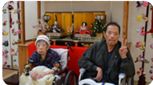
御夫婦で写真撮影です。